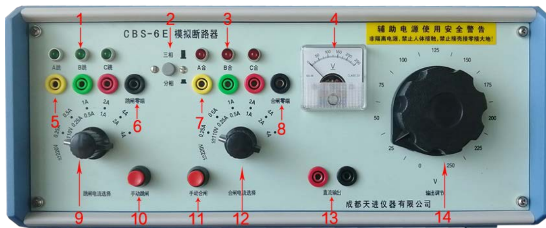
图-1 CBS-6E 仪器面板功能